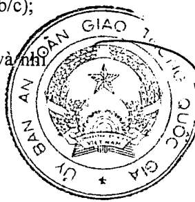
Khuất Việt Hùng